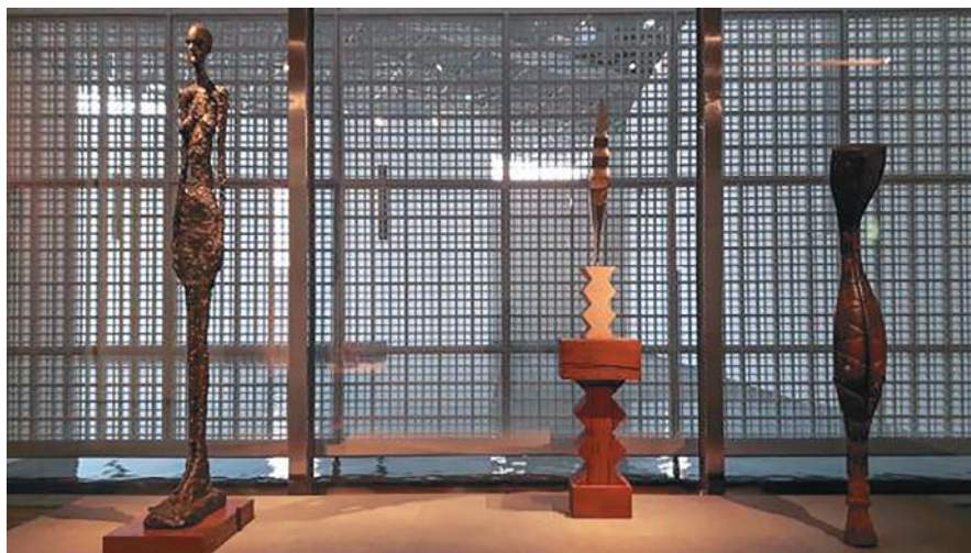
Илл. 3. Скульптуры Альберто Джакометти, Константина Бранкузи и Змеинная маска из Папуа — Новой Гвинеи в одном выставочном пространстве.

мирования коллекции. Собранные усилиями ведущих экспертов экспонаты отличает отменное качество, однако 300 скульптур и полотен явно недостаточно для наполнения музея такого масштаба.