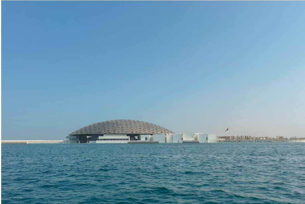
Илл. 1. Лувр Абу-Даби, вид с водной глади. Архитектор Жан Нувель