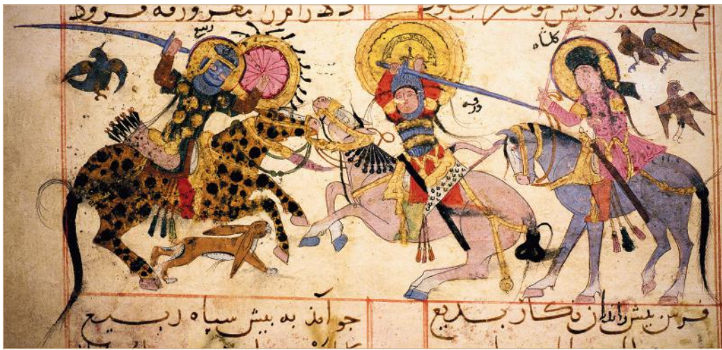
Илл. 4 (a, b). Миниатюры XIII в., иллюстрирующие роман Айюки «Варка и Гюльшах» (XI в.) Всадник справа на Илл. 4a держит копьё наперевес, а часть доспеха, покрывающая голову и шею, напоминает норманнский хауберк.

Румского султаната, эмирата Данышмендидов и т. д., питательной основой которых были кочевые орды туркоманов и огузов.