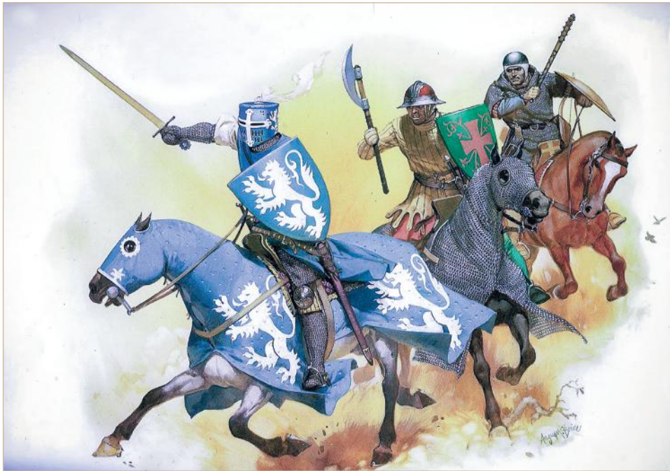
Илл. 7. Конный сержант и туркопол поддерживают атаку рыцаря из Антиохии (1268 г.) По: Angus McBride © Osprey Publishing

ческий прием, при котором пехота использовалась «исключительно для поддержки кавалерии» [Дуглас, 2003, с. 132]. Тем не менее ни одна армия, действовавшая на Востоке, не смогла бы выжить без конных лучников. Легкая кавалерия, известная как «конные сержанты» существовала в западноевропейских армиях наряду с тяжелой конницей, но специфика боевых действий в Азии против сельджуков поставила перед крестоносцами вопрос о создании нового вида легкой кавалерии, известно-го как туркополы [France, 2000, p. 51] 31 .