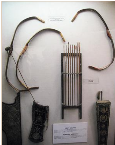
Илл. 3. Турецкий лук. Музей дворца Топкапы, Стамбул.

тюркам-сельджукам и арабам на Ближнем Востоке, где, в частности, его и мог изучить и перенять Усама ибн Мункыз [Flogi, 1988, p. 240].