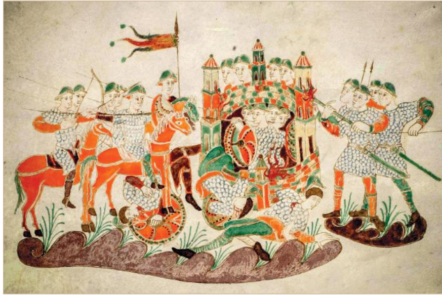
Илл. 6. Группа франкских всадников из миниатюры «Золотой Псалтири» IX в.

тели допускают, что некоторые «короткие луки», вышитые на гобелене, являлись композитными по своей структуре и происходили из Южной Европы. Применять подобные луки могли нанятые Вильгельмом чужеземцы [Nicolle, Gravett, 2006, p. 25]. Изображения конных лучников встречаются в манускриптах Каролингской эпохи. На одной из иллюстраций Золотой Псалтири IX в. из монастыря Св. Галлена изображена группа франкских всадников, одетых в броню, со шпорами на ногах, один или два из которых стреляют из лука по осажденной крепости [Nicolle, Gravett, 2006, p. 25] (Илл. 6).