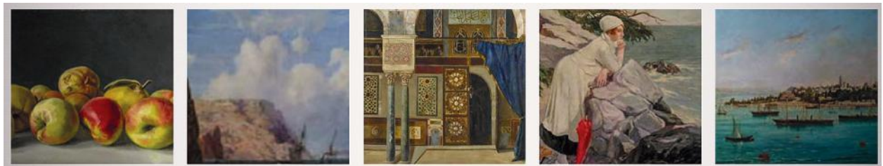
Илл. 9. Образцы живописи, в том числе, Ивана Айвазовского, из музея Сагыпа Сабанджи (детали) Courtesy © Sakıp Sabancı Museum. По: URL: https://www.sakipsabancimuzesi.org/en/collections/arts-book-and-calligraphy-sakip-sabanci-museum

Османская живопись представляет собой другую масштабную часть коллекции Музея Сагыпа Сабанджи. В коллекции представлены полотна художников Константина Капыдагы (конец XVIII в.), Османа Хамди Бея (1842–1910) (см. о нем: [Вяземская, 2019]), Шекера Ахмеда Паши (1841–1907), Фейхамана Дурана (1886–1970) и других. Музей позиционирует свою коллекцию