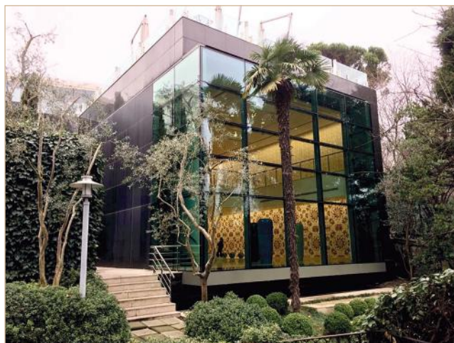
Илл. 10. Современная пристройка для экспонирования «привозных» выставок, искусства XX века и актуального искусства

живописи как логическое продолжение коллекции каллиграфии, отмечая неотъемлемую связь этих двух этапов истории османского изобразительного искусства.