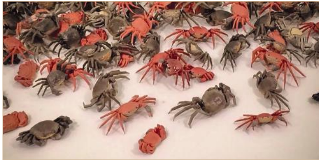
Илл. 11 (а, b). Фарфоровые крабы