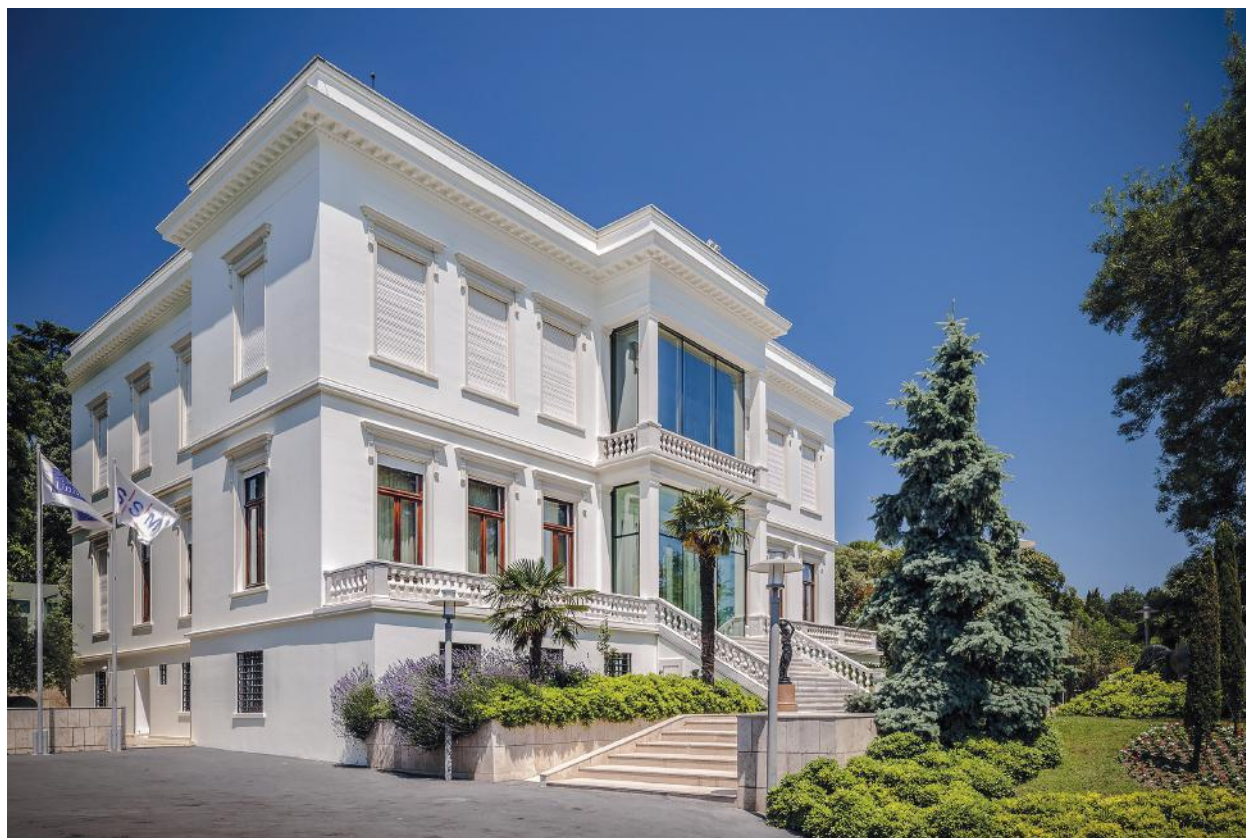
Илл. 1. Особняк семьи Сабанджи — дом одноименного музея.

ных культурных учреждений страны. Хотя музей не попадает в стандартные туристические маршруты и часто остается за пределами внимания иностранных посетителей Стамбула, он