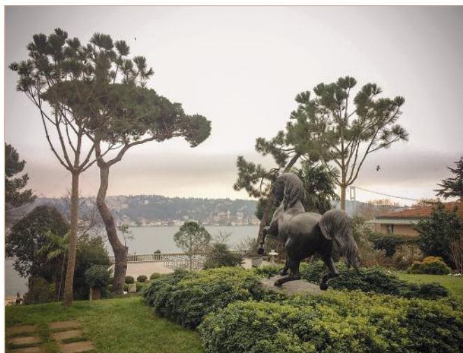
Илл. 3. Знаменитая статуя лошади авторства французского скульптора Луи-Жозефа Домá — символ музея