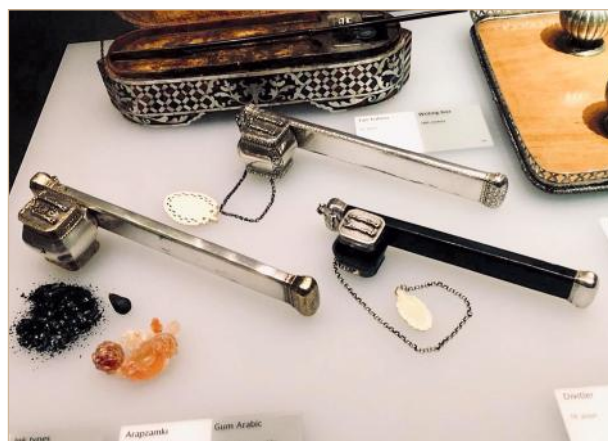
Илл. 7. Инструментарий турецкого и арабского каллиграфа, 2018.