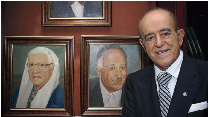
Илл. 4. Сақып Сабанджи с портретами родителей — отца Хаджи Омера и матери Садики Сабанджи