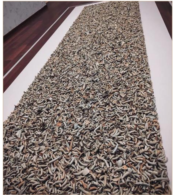
Илл. 12. «Носики». Тысячи носиков от чайников времен династии Сун (1279–960) собирались Ай Вэйвэем в течение многих лет и выложены в инсталляции как ковер, чтобы переопределить понятия ценности, древности, современности и создать метафору свободы слова Фото © Д. Дубровская, 2018