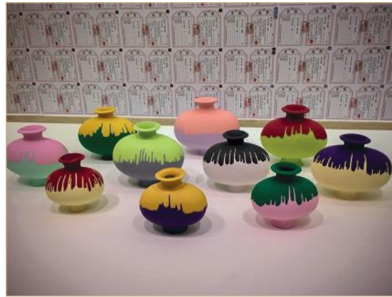
Илл. 14. Оригинальные вазы времен династии Мин (1368–1644), окрашенные художником при помощи промышленных красителей.

музеями мира помогает Стамбулу оставаться связующим звеном и мостом между западной и восточной цивилизацией, которым город являлся на протяжении многих столетий.