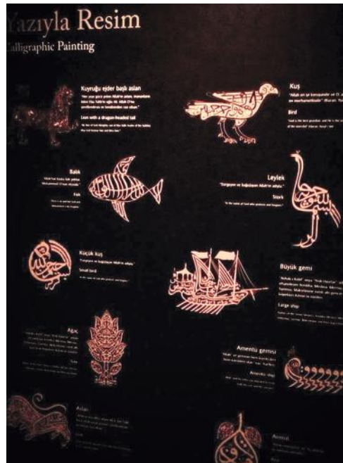
Илл. 8. Образцы арабской каллиграфии в форме представителей фауны

каллиграфические панели, официальные документы с печатью султана и многое другое. В постоянной экспозиции музея представлена лишь треть работ: из-за хрупкости и чувствительности к свету многие экспонаты доступны зрителями лишь на временных выставках. Также в коллекцию входят инструменты каллиграфов, которые использовались для создания рукописных шедевров, сделанные из серебра, слоновой кости и панциря черепахи (Илл. 6–8).