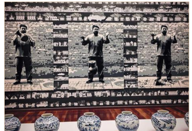
Илл. 13 (а, b). В одном из залов выставки были представлены стилизованные обои, изображающие трагедию беженцев, посвященные той же теме аутентичные фарфоровые вазы, расписанные художником, и три фотографии самого скандального перформанса Ай Вэйвэя — процесса разбиения вазы времен династии Хань (206 до н. э. – 220 н. э.)