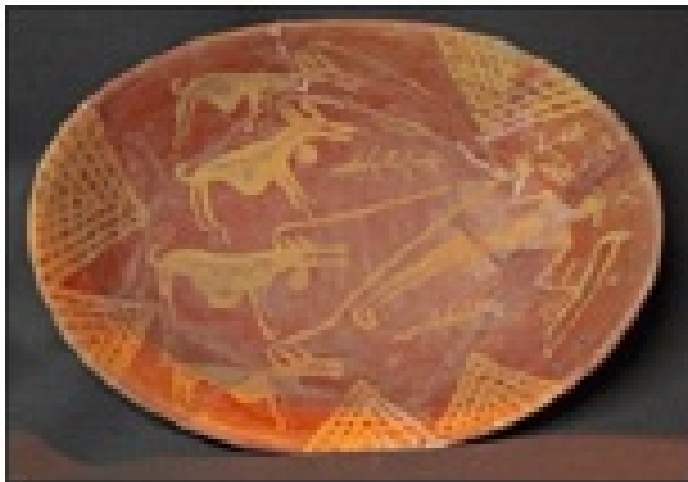
8 Илл. 3. Овальная миска со сценой охоты, период Нагада I. I, 1а 4777 (по: >>>> (accessed 20.04.2021))