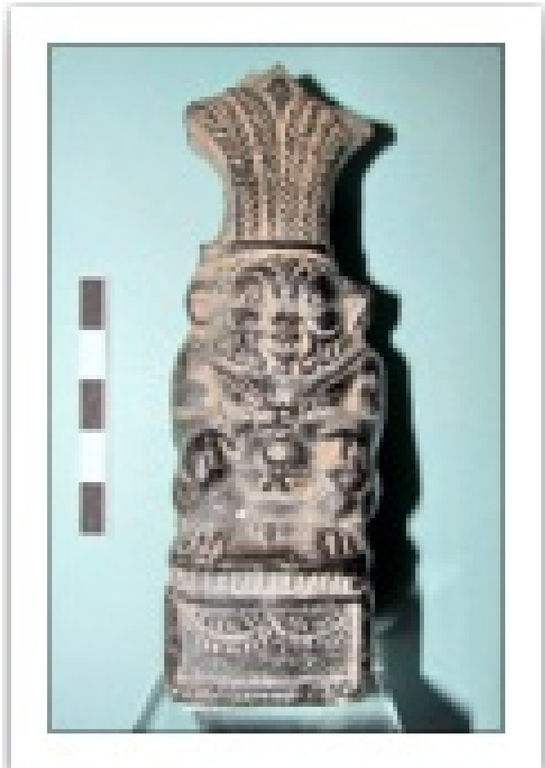
28 Илл. 8. Рельефный сосуд в виде бога Бэса, Memphis Black Ware, I в. до н. э. — середина I в. н. э. I, 1а 4274

29 Таким образом, коллекция древнеегипетских керамических сосудов, собранная