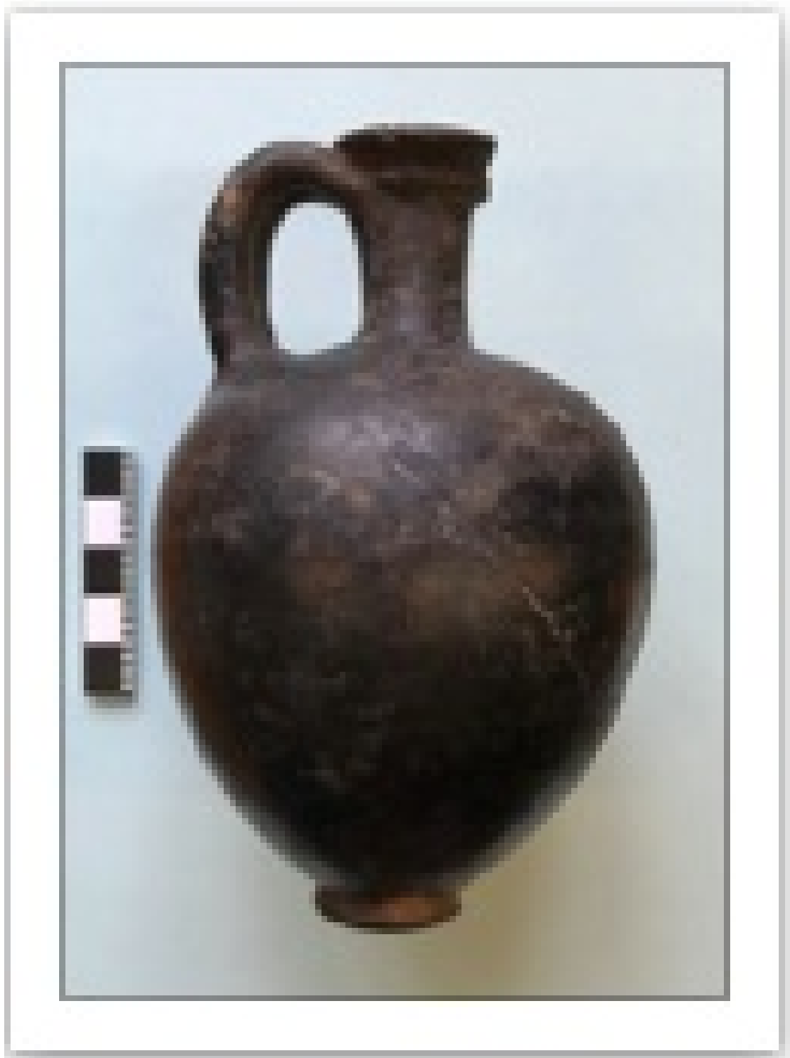
25 Илл. 7. Чернолаковый лекиф египетского производства (мастерские Буто?), V–IV вв. до н. э. © ГМИИ, I, 1a 1466 (фото С. Е. Малых)

26 Как и во всех остальных случаях, керамика греко-римского времени (332 г. до н. э. — 395 г. н. э.) представлена, образно выражаясь, «точечными уколами шпаги мастера». Репрезентативной является группа небольших рельефных сосудов с черной полублестящей поверхностью, вероятно, производившаяся в мастерских Мемфиса (т. н. Memphis Black Ware) в I в. до н. э. — I в. н. э., в том числе в виде бога-карлика Бэса ( Илл. 8 ), а также их аналоги из красных глин, которые могли изготавливаться в гончарнях Фаюмского оазиса и дельты Нила [Васильева, Малых, 2016]. Среди сосудов Римского периода примечательна крупная амфора, декорированная налепами в виде лица бога Бэса. Близкие по форме и декору предметы имеются в коллекциях музеев Каира, Амстердама и Кэмбриджа [Bourriau, 1981, p. 38, no.54]. В случае московского сосуда мы можем констатировать, вслед за Ж. Буррье, что его глина типична для Римского периода и обычно использовалась для изготовления больших амфор