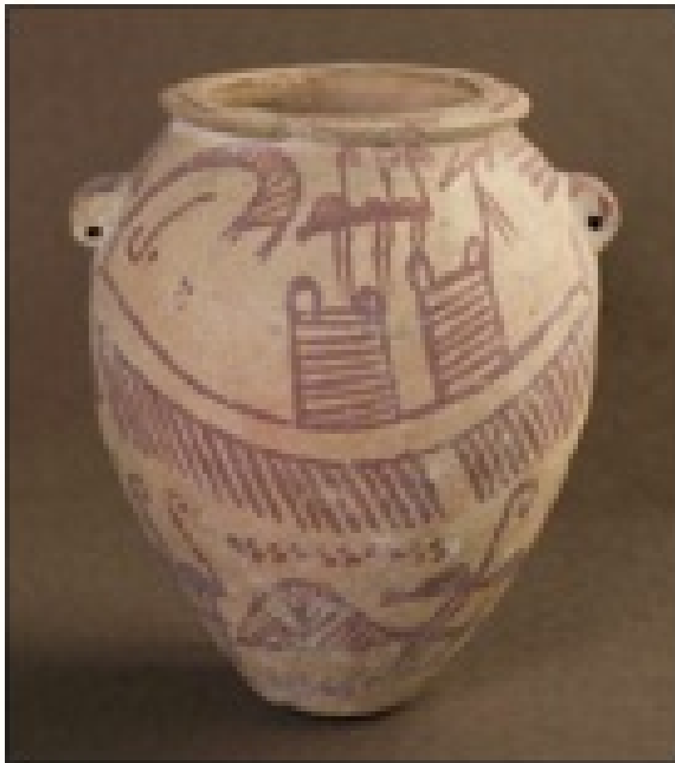
10 Илл. 4. Кувшин с изображением лодок, период Нагада II. (по: >>>> (accessed 20.04.2021))