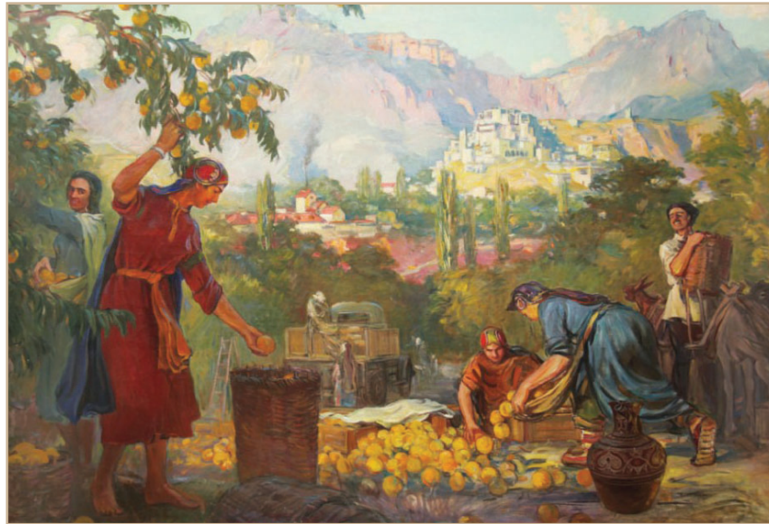
Илл. 3. М.-А. Джемал. Август. Сбор персиков. 1959