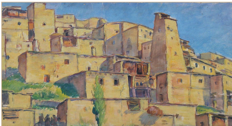
Илл. 5.1. Е. Лансерэ. Аул Тидиб в Дагестане. 1925 По: URL: https://www.tg-m.ru/catalog/en/artists/2695 (accessed 10.11.2022). Fig. 5.1. Eug. Lanceray. Tidib Village in Dagestan. 1925 Source: Gallery. The Tretyakov Gallery Magazine URL: https://www.tg-m.ru/catalog/en/artists/2695 (accessed 10.11.2022).