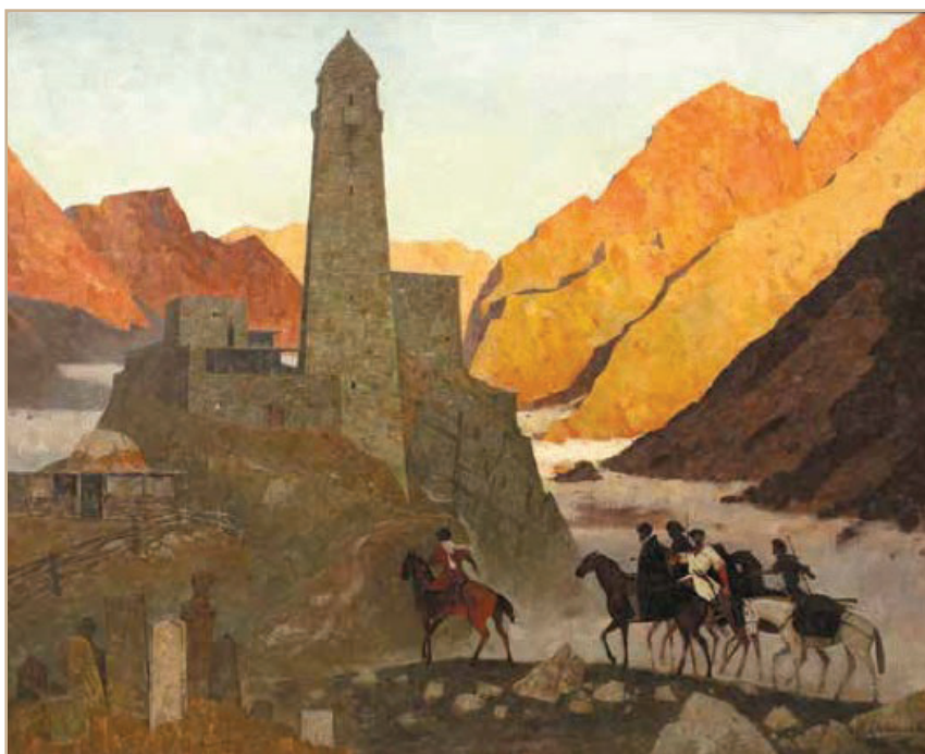
Илл. 5.2. Артур Абдуллаев. Возвращение. 2013 Fig. 5.2. Artur Abdullaev. The Return. 2013.