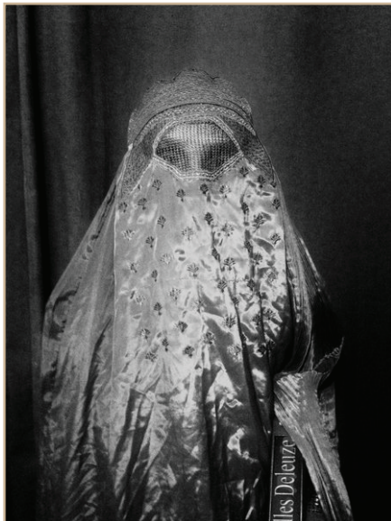
Илл. 4.1. Аль-Хала. По: [Биеннале Современного Искусства Кавказа... 2019, с. 294]