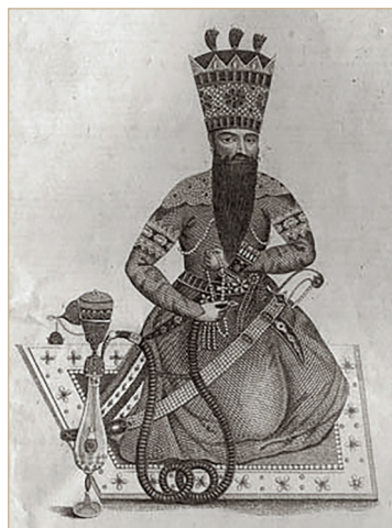
Илл. 1. Портрет Фетх Али-шаха