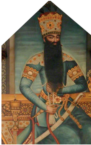
Илл. 6. Портрет Фетх Али, шаха Ирана (1772–1834) 1800–1806 гг. 159 × 94 см. Холст, масло Бодлианская библиотека, Оксфорд Fig. 6. Portrait of Fath Ali, Shah of Iran (1772–1834) 1800–1806. 159 × 94 cm. Oil on canvas Bodleian Library, Oxford Source: URL: https://digital.bodleian.ox.ac.uk/objects/4731f3aa-de32-483a-b1c8-5f246f63c7e6/ (accessed 29.11.2022)

том, является ли автором рисунка именно Тернер. Если между живописцем и гравером существовало промежуточное звено, то рисовальщик мог сделать рисунок на месте и лишь затем привезти его в Англию.