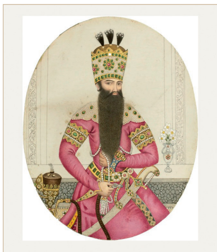
Илл. 8. Портрет Фетх Али-шаха из альбома У. Фрейзера. Ок. 1815–1820 гг. 12.5 × 9.8 см. Бумага, тушь, непрозрачная акварель. Галерея «Франческа Гэлловей», Лондон