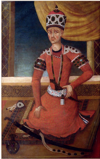
Илл. 2. Ага Мохаммед-шах Каджар. Ок. 1820 г. 167.7 × 105.1 см. Холст, масло Аукционный дом Christie's, Лондон Fig. 2. Agha Mohammed Shah Qajar. Ca. 1820 167.7 × 105.1 cm. oil, canvas Auction house Christie's, London