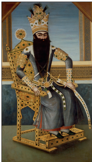
Илл. 4. Голам Мехр Али Мирза. Фетх Али-шах Каджар. 1800–1806 гг. Лувр, Париж Fig. 4. Golam Mehr Ali Mirza. Fath Ali Shah Qajar 1800–1806. Louvre, Paris