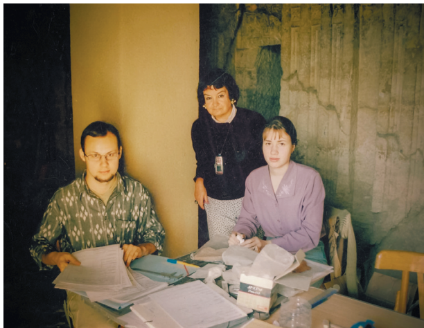
Со студентами РГГУ на практике в Гизе (2008 год) Practice with the students of Russian State University for the Humanities in Giza (2008)

Судан, хотите — Египет». И вот год назад нас посетил заместитель главы суверенного правительства Судана господин Мухаммад Хамдан Дагло (Хамадти) 3 .