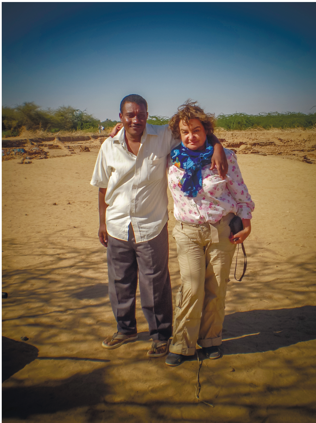
С инспектором в Судане (2012 год) With an archaeology inspector in Sudan in 2012