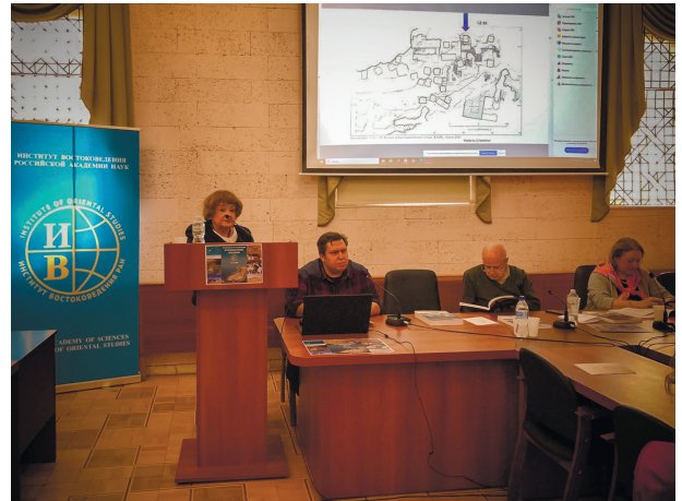
Выступление на конференции «Полевые исследования на Востоке» в Институте востоковедения (апрель 2023 г.) Talk at the Field Research in the East conference at the Institute of Oriental Studies (April 2023)