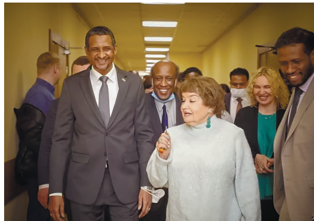
Встреча в РГГУ с тогдашним заместителем Председателя Суверенного Совета Судана генералом Мухаммадом Хамданом Дагло (Хамадти) (2021 год)