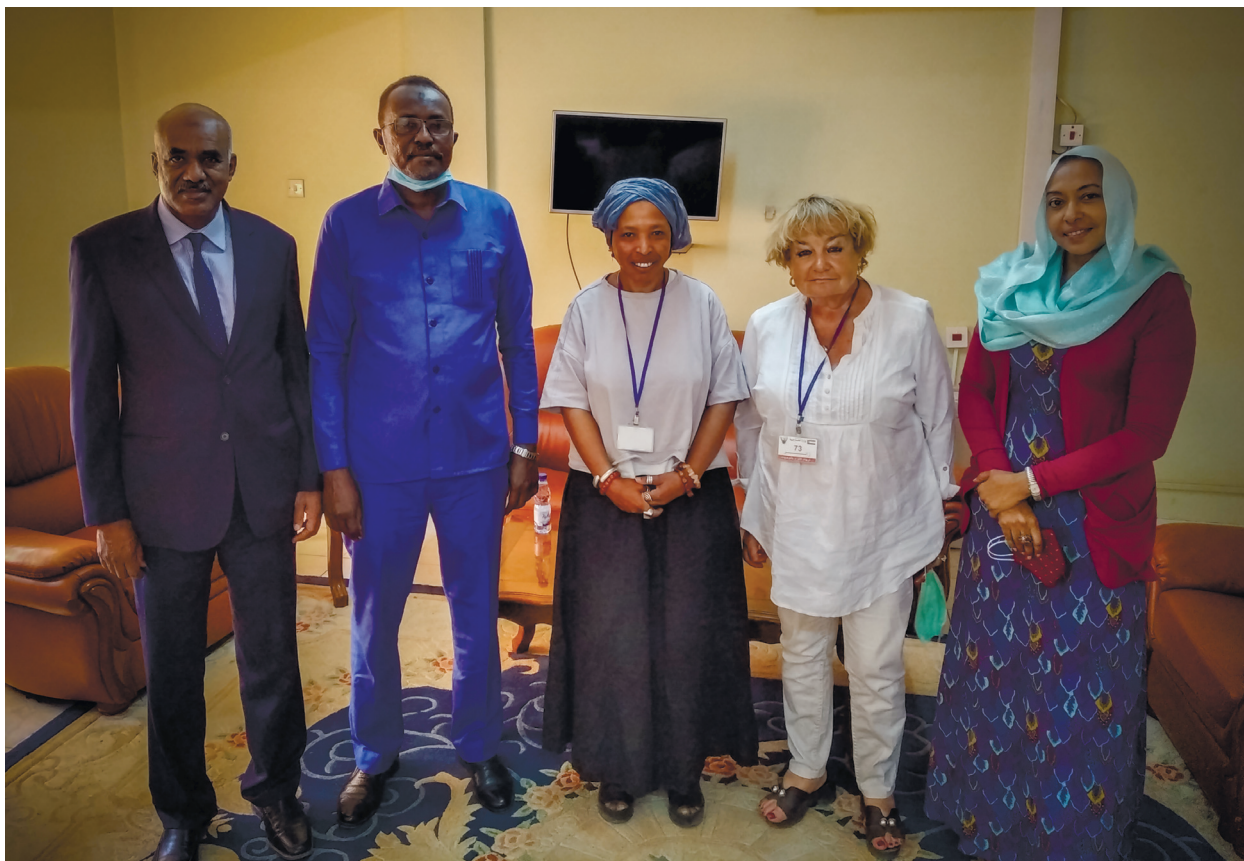
Прием в МИДе Судана. Фото с сотрудниками министерства Reception at the Sudanese Foreign Ministry. Photo with ministry employees

на ремонт, мебель, — и все это получило в Судане одобрение. Через некоторое время пришли деньги, мы заказали ремонт, купили технику, мебель и торжественно открыли центр в октябре двадцать второго года.