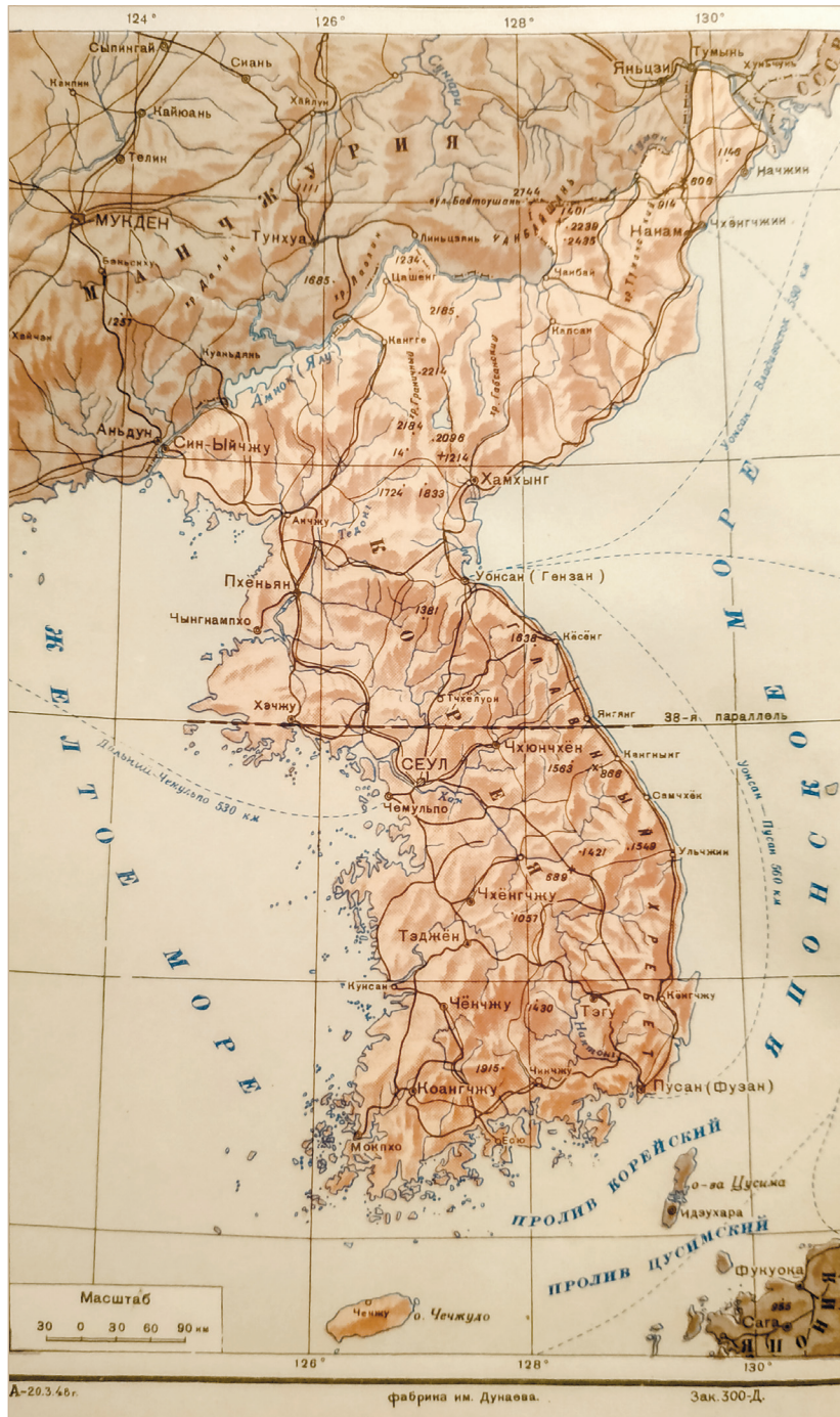
Илл. 3. Карта Корейского полуострова Fig 3. The Map of Korean Peninsula