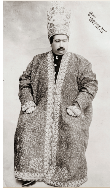
Илл. 8. Корона Киани.