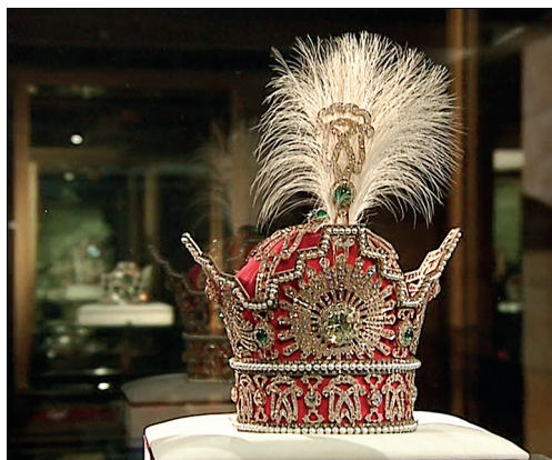
Илл. 7. Корона последнего шаха Ирана Мохаммада Реза Пехлеви

шахом Афшаром) заняли тогдашнюю иранскую столицу Исфахан, вывоз ценностей из страны удалось остановить, после чего Надир отправился в Индию возвращать другую часть драгоценностей (он написал индийскому двору письма, но не получил удовлетворительного ответа). После похода Надира в Индию, Мухаммад-шах 13 передал Надиру наличные деньги, драгоценности и оружие, однако на обратном пути в Иран часть имущества и казны, полученная Надиром в Индии, пропала. После возвращения в Иран Надир отправил значительную долю сокровищ в качестве подарков правителям соседних стран. Кроме того, часть драгоценностей он передал на поддержание архитектурного комплекса мавзолея восьмого шиитского имама Резы (Ар-Риды; 770–818) в городе Мешхеде [Saadat, 1976], а часть распределил среди своего войска.