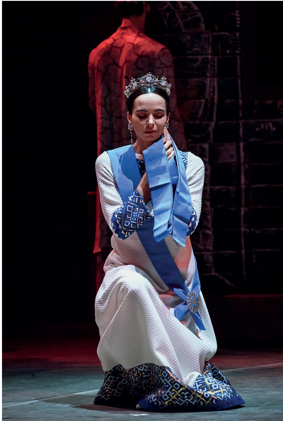
Илл. 6. Диана Вишнева с синей лентой в сцена коронации Фарах Пехлеви из балета «Шехерезада»