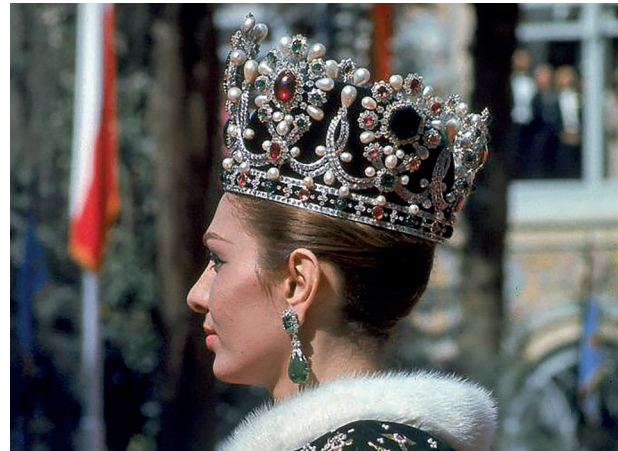
Илл. 5. Фарах Пехлеви в короне и ожерелье от Пьера Альперса

По: URL: https://ru.wikipedia.org/wiki/Корона_Шахбана (accessed 12.11.2021)