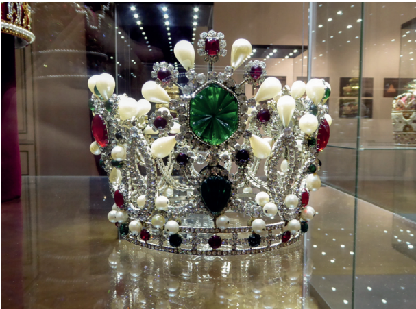
Илл. 4. Коронационный убор Фарах Пехлеви производства Пьера Альперса