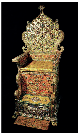
Илл. 10. Трон Надира.

У правителя Индии султана Ала ад-Дина Хилджи 18 (1266–1316) было три сына: Хизр-хан, Шихаб уд-дин Умар и Кутб уд-дин Мубарак. По легенде, после смерти отца ставшие претендентами на царство сыновья решили разделить всю территорию страны на три части, для чего отправились в путешествие по владениям отца. В горах путешественников застал ливень, и они решили укрыться от непогоды в близлежащей пещере. Войдя внутрь, они увидели, что пещера освещена необычным светом, исходящим от алмаза, лежащего на гранитном камне. Братья заспорили, кому он должен принадлежать и стали молиться богам: Хизр-хан — Вишну, Умар — душе мира Брахме, а Мубарак — богу-разрушителю Шиве. Шива услышал молитву Мубарака и пустил в алмаз молнию, после чего он раскололся на три части. Каждый осколок превышал по весу семьсот каратов. Хизр-хан взял себе самую крупную часть, которую назвал «Дарья-йе-нур» — «море света». Умар назвал свой камень «Кохи-нур» — «гора света», а Мубарак дал своему камню имя «Хинди-нур» — «свет Индии».