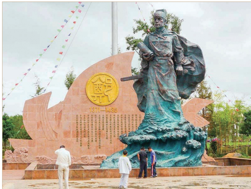
Илл. 1. Памятник Чжэн Хэ в Куньмине

Вскоре после узурпации трона третий минский император Юнлэ (永樂; правил: 1402–1424) поставил задачу продемонстрировать богатство и мощь Китая в странах Южных морей и Западного океана, ныне называемых Юго-Восточной Азией и странами Индийского океана, то есть, всюду, куда можно было добраться из Срединной империи по морю. Для достижения цели император повелел выстроить флот, состоящий из самых больших кораблей, известных человеку и волнам. Уже через три года (в 1405 г.) китайская армада отправилась в первое из семи путешествий по водам Западного полушария. Командование экспедицией было возложено на получившего звание адмирала ( шанцзян ; 上将) Чжэн Хэ — дворцового евнуха ( тайцзянь ; 太監), служившего Юнлэ с 1381 г. Хотя на тот момент Чжэн Хэ не обладал навигаторским опытом, он успел зарекомендовать себя как преданный