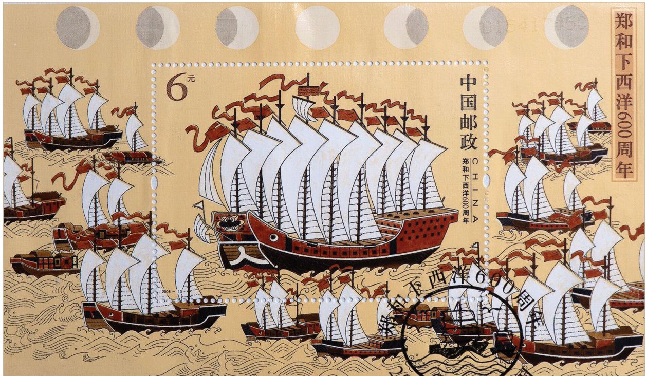
Илл. 3. Китайская марка, выпущенная в память о флотилии адмирала Чжэн Хэ